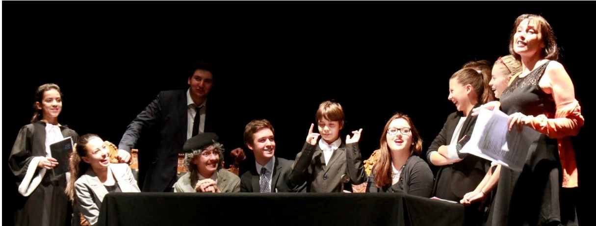
La petite troupe du Chêne Noir durant les répétitions de L'Épidémie