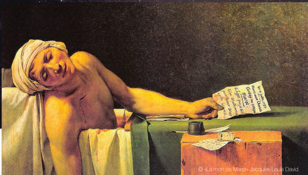
© «La mort de Marat» Jacques-Louis David