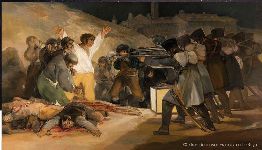
© «Tres de mayo» Francisco de Goya