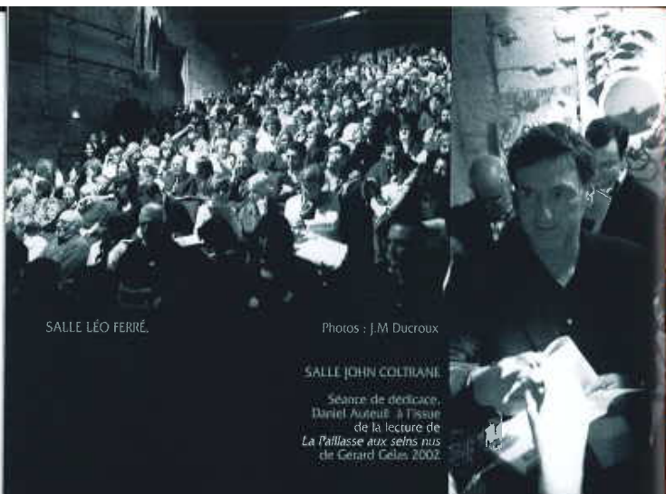
SALLE LÉO FERRÉ.

Dates et spectacles sous réserve de modifications Saison d'Abonnements - Locations