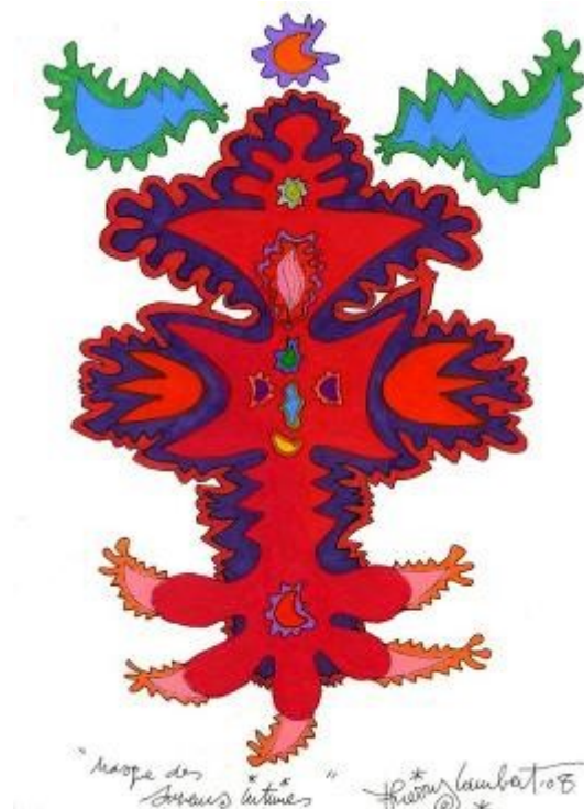
Masque des saveurs intimes