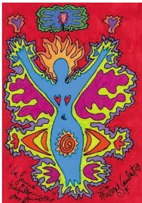
La femme papillon des aurores