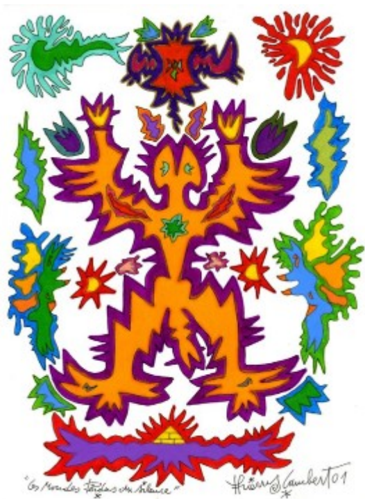
Les mondes perdus du silence