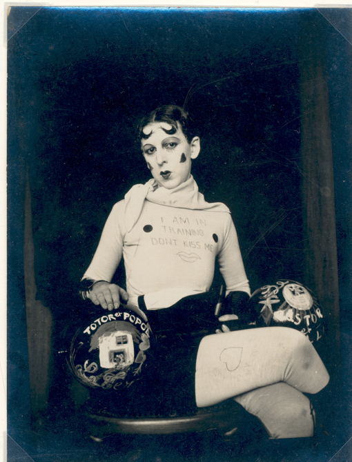
I am in training don't kiss me by Claude Cahun c.1927

Lectures : Simona Locic - Franchir le seuil féerique. Barbe-Bleue - du conte populaire au roman - Réinvention de l'héroïne féerique dans le roman Barbe bleue d'Amélie Nothomb (2019)