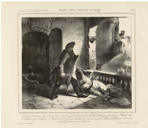
Barbe bleu, blanche et rouge - Grandville (Nancy, 15-09-1803 - Vanves, 17-03-1847), dessinateur