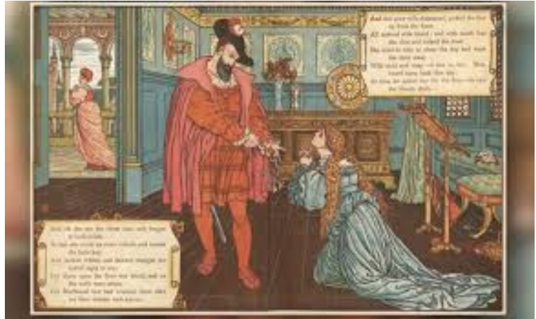
Walter Crane, chromoxylographie d'Edmund Evans, planche 4 (p. 4-5) de Bluebeard , Londres, John Lane, 1898.