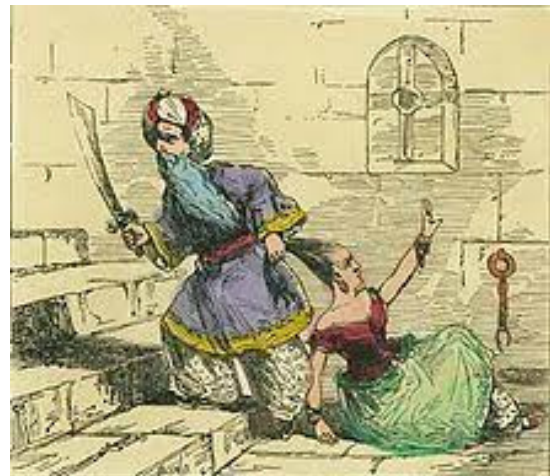
Barbe bleu , illustration d'Edmund Evans, vers 1888.