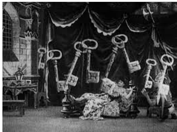
Barbe-Bleue - adaptation cinématographique de Georges Méliès, 1901