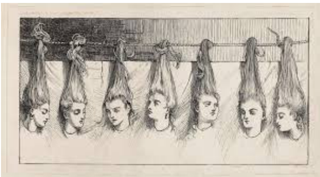
What She Sees There gravure de Winslow Homer pour une mise en scène de Barbe-Bleue in Harner's Bazar. 1868