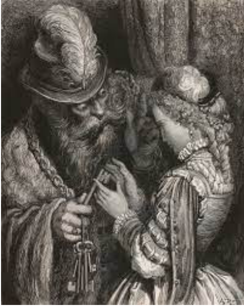
La Barbe-Bleue, gravure sur bois de Gustave Doré ornant Les contes de Perrault , Paris, Jules Hetzel, 1862.