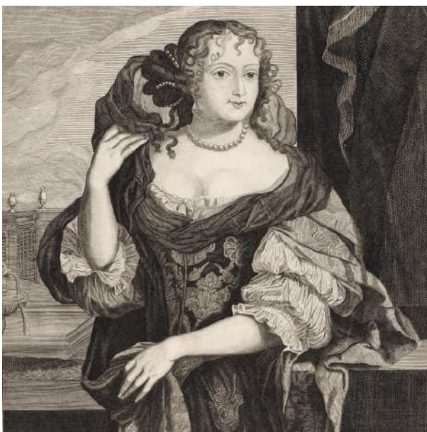
Portrait de femme (Madame de Montespan ?)

menées de son mentor et futur mari. La démonstration est émaillée de discours flatteurs sur le sentiment amoureux, qui font écho au questionnement qui avait cours dans ces lieux d'échange intellectuel qu'étaient les salons et qui se traduisent parfois par la formulation de maximes (ainsi « l'amour est un grand maître. / Ce qu'on ne fut jamais il nous enseigne à l'être », v. 900-901).