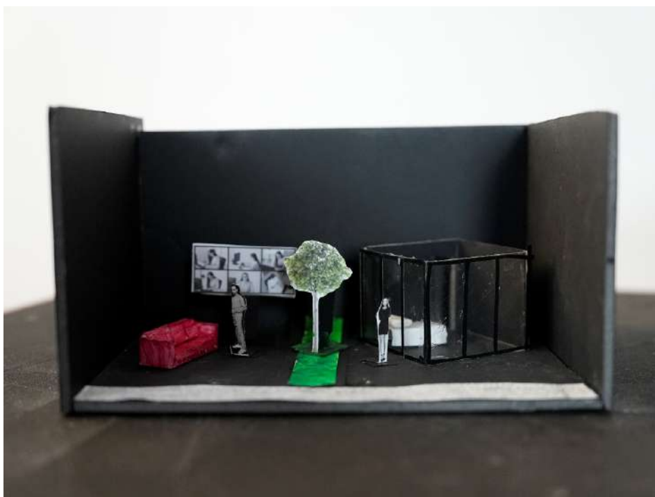
Maquette du décor par François Cabanat

Cette scénographie renvoie également une image que nous ne sommes pas sans reconnaître et qui interroge peut-être aussi ce qu'il nous reste de liberté, de nature, d'espace personnel, de secret... et de naïveté ?