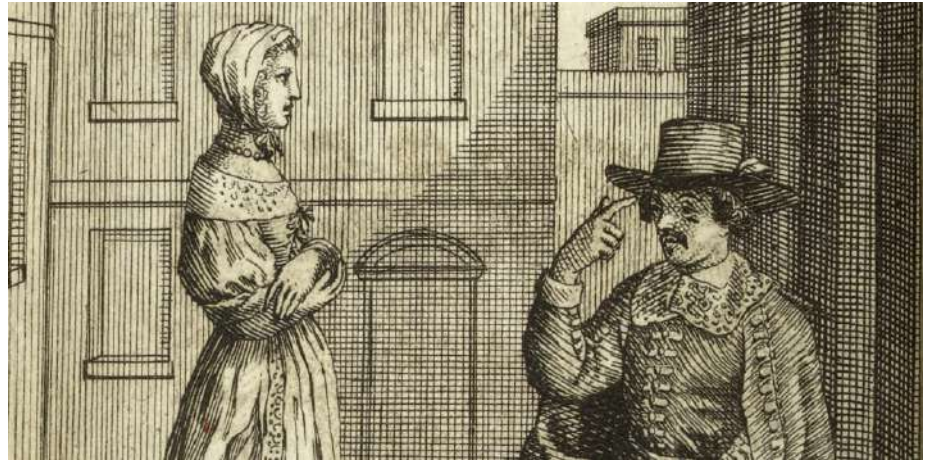
L'École des femmes , frontispice de François Chauveau (Molière joue Arnolphe)

[Article de Claude Bourqui, professeur de littérature française à l'Université de Fribourg, publié à l'occasion de l'exposition Molière, le jeu du vrai et du faux , présentée à la BnF du 27 septembre 2022 au 15 janvier 2023.]