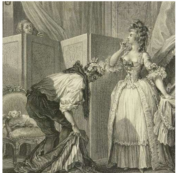
Le Cocu battu et content Bibliothèque nationale de France

Ainsi le cocuage que craignait Arnolphe offrait un cas de figure d'adversité, donnant lieu à des prises de position ainsi qu'à des commentaires longuement échangés entre le héros et son fidèle ami Chrysalde. Ce dernier invitait à une attitude d'accommodement et de modération, dans laquelle étaient reconnaissables les principes de la philosophie sceptique. Arnolphe, à l'opposé, dans son acharnement à se prémunir contre les coups de la fortune, apparaissait comme un adepte de l'opiniâtreté des stoïciens. L'exposé virtuose des deux positions antagonistes présentait ainsi sous un jour nouveau et attrayant deux modes de pensée vénérables par leur origine antique. L'École des femmes s'affirmait ainsi comme une œuvre éminemment moderne.