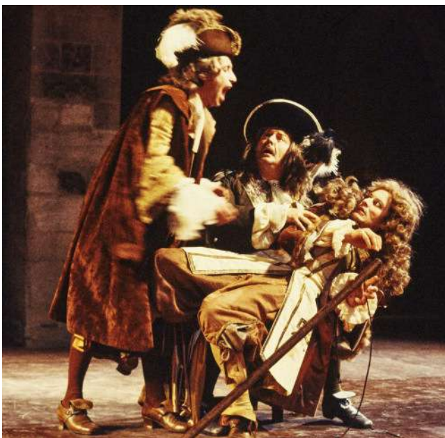
L'École des femmes , de Molière

Créée le lendemain de Noël 1662, la comédie de L'École des femmes a véritablement sidéré le public parisien qui se pressait en nombre dans la salle du Palais-Royal, sise immédiatement en face du Louvre. Molière y présentait pour la première fois un spectacle exploitant le potentiel du scandale.