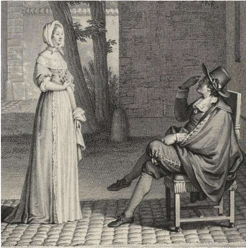
Arnolphe et Agnès dans L'École des femmes Bibliothèque nationale de France

menées de son mentor et futur mari. La démonstration est émaillée de discours flatteurs sur le sentiment amoureux, qui font écho au questionnement qui avait cours dans ces lieux d'échange intellectuel qu'étaient les salons et qui se traduisent parfois par la formulation de maximes (ainsi « l'amour est un grand maître. / Ce qu'on ne fut jamais il nous enseigne à l'être », v. 900-901).